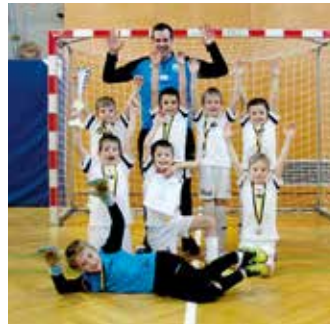
SCP-U-08 immer im Spitzenfeld

tollen Leistungen. Mehrere Final- und Spitzenplatzierungen unterstreichen die positive Entwicklung im Jugendbereich und die engagierte Arbeit der Trainerinnen und Trainer, die Woche für Woche wertvolle Nachwuchsarbeit leisten.