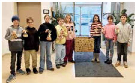
Nachmittag im Pflegeheim. Übergabe der gebackenen Kekse an die Pflegeheimbewohner.