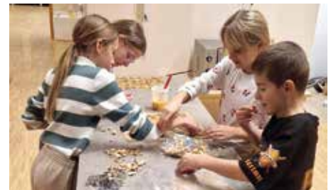
Gemeinsames Backen fürs Seniorenheim. Die Lebkuchenproduktion.

Am 13. Dezember durften wir diese in der Mavida Residence Pernegg persönlich überreichen. Acht von uns verbrachten einen wunderbaren Nachmittag mit den Bewohnerinnen und Bewohnern. Wir spielten gemeinsam Brettspiele, lachten viel und führten nette Gespräche. Für uns war das ein ganz besonderer Moment. Solche gemeinnützigen Aktionen zeigen, wie viel Freude man mit kleinen Gesten bereiten kann.