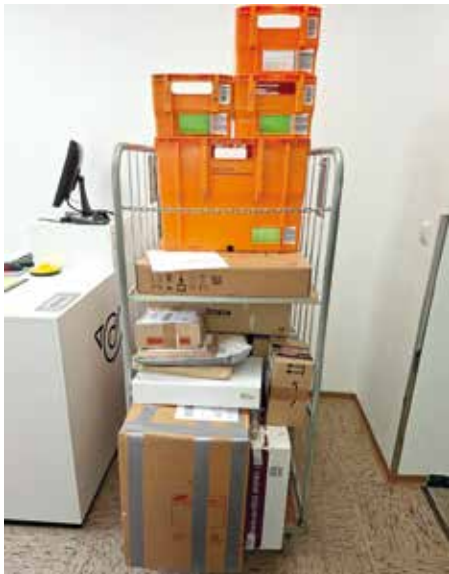
So sah es bereits nach zweieinhalb Stunden Öffnungszeit am Tag 1, 20. Jänner aus. Die Leute haben sehnhchst darauf gewartet.

Sehr erfreulich ist auch die Entwicklung rund um unseren neuen Postpartner im Gemeindeamt . Dieses Service wird von der Bevölkerung sehr gut angenommen und erleichtert vielen Bürgerinnen und Bürgern den Alltag.