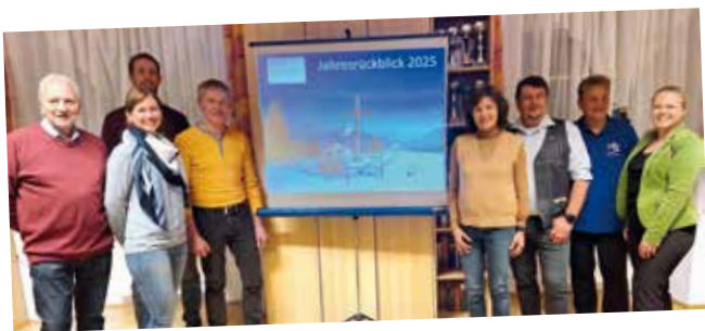
Naturfreunde-Treffen - die bewährte Führungsriege