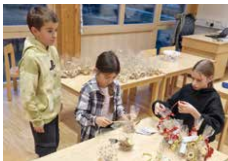
Gemeinsames Backen fürs Seniorenheim. Auch das liebevolle Verpacken der Kekse ist eine aufwendige Arbeit.