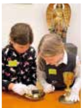
2. Klassen - Museumsbesuch: Die Kinder der beiden 2. Klassen besuchten im Februar das Museums-Kinder-Programm „Es funkelt in Gold und Silber“ im Diözesanmuseum Graz.