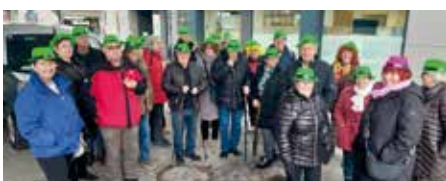
Die Pernegger waren leicht zu finden - mit den grünen Hüten.

Am Faschingsamstag ging die Reise mit der Koralmbahn zum Villacher Faschingsumzug. Ein besonderes Erlebnis war es unter den tausenden maskierten Besuchern und Teilnehmern am Umzug die fröhliche Stimmung zu genießen.