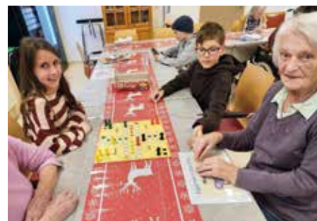
Nachmittag im Pflegeheim. Zeit mit den Senioren.

Ein weiterer Flohmarkt ist ebenfalls geplant – diesmal Open Air, voraussichtlich an einem Sonntag vor dem neuen Spar-Markt in Pernegg. Dort dürfen gerne auch Erwachsene ihre Raritäten verkaufen. Sobald das Datum fixiert ist, informieren wir rechtzeitig. Langfristig möchten wir mit unseren Projekten Geld für neue Spielgeräte in Pernegg sam-