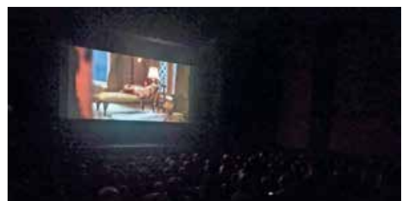
Kino: Als Weihnachtsüberraschung übernahm der Elternverein der VS Pernegg den gesamten Kinobesuch der Kinder in Bruck an der Mur – den Kinobesuch, die Popcorn und die Getränke. Vielen Dank!