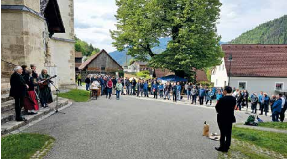
Marienstockschießen: Großer Erfolg schon bei Premiere.