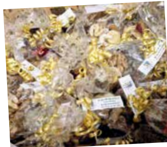
Kindergemeinderat Die fertig verpackten Kekse.