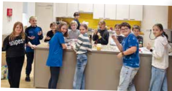
Kindergemeinderat Gemeinsames Backen fürs Seniorenheim. Der KiGRa bei der Arbeit.