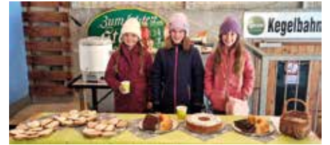
Flohmarkt am Pernegger Sportplatz. Für Speis und Trank wurde gesorgt.