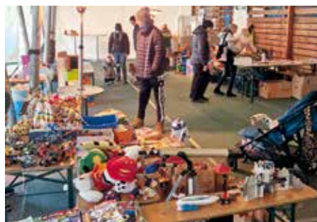
Flohmarkt am Pernegger Sportplatz. Eine große Auswahl an tollen Spielsachen und anderen Second Hand Artikeln.

Ende November organisierten wir unseren ersten Kinderflohmarkt am Sportplatz in Pernegg. Trotz kühler Temperaturen nutzten viele Familien die Gelegenheit, gut erhaltene Spielsachen und andere Second-Hand-Waren anzubieten. Wir kümmerten uns um die Organisation sowie um Speis und Trank. Für uns war es schön zu sehen, wie Nachhaltigkeit ganz praktisch gelebt werden kann.