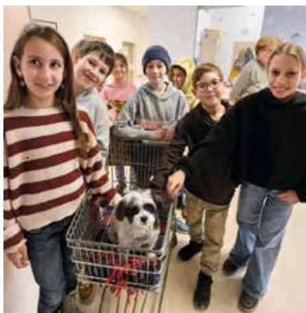
Nachmittag im Pflegeheim. Übergabe der gebackenen Kekse an die Pflegeheimbewohner.

Auch für die kommenden Monate haben wir einiges geplant. Heuer möchten wir an der „Steirer Teller Challenge“ der Landentwicklung Steiermark teilnehmen. Dabei geht es