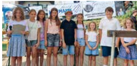
Verkündung der Schätzsiegerin beim Pernegger Kirtag 2025.

Unser erstes großes Projekt war ein Schätzspiel beim traditionellen Pernegger Kirtag am 15. August. Die Vorbereitungen waren umfangreich. Preise organisieren, alles genau planen und vorbereiten – und dann auch noch auf der großen Bühne stehen! Viele von uns waren sehr nervös. Doch gemeinsam haben wir die Preisverleihung großartig gemeistert. Es war ein voller Erfolg, und wir bedanken uns herzlich bei allen Unterstützerinnen und Sponsoren.