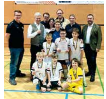
SCP-U-10 mit Turniersieg