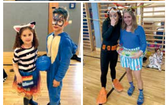
Fasching: Buntes Treiben - Ein lebhaftes, fröhliches und lustiges Geschehen in der Volksschule