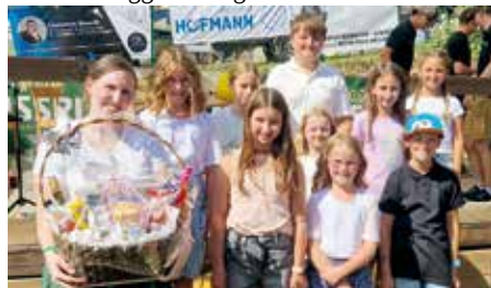
Gewinnerin des Hauptpreises vom KiGra Schätzspiel mit allen anwesenden Kindergemeinderätinnen beim Pernegger Kirtag 2025.

Ende November organisierten wir unseren ersten Kinderflohmarkt am Sportplatz in Pernegg. Trotz kühler Temperaturen nutzten viele Familien die Gelegenheit, gut erhaltene Spielsachen und andere Second-Hand-Waren anzubieten. Wir kümmerten uns um die Organisation sowie um Speis und Trank. Für uns war es schön zu sehen, wie Nachhaltigkeit ganz praktisch gelebt werden kann.