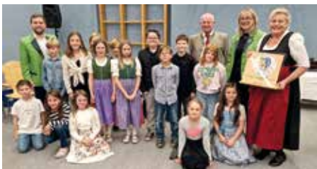
Angelobung der Kindergemeinderäte und Kindergemeinderätinnen.

Im Dezember 2024 wurden 17 engagierte Kinder feierlich angelobt. Zwei von uns vertreten seither als Kinderbürgermeisterin und Kinderbürgermeister die Anliegen der jungen Perneggerinnen und Pernegger. Dieser feierliche Moment war für uns alle sehr aufregend.