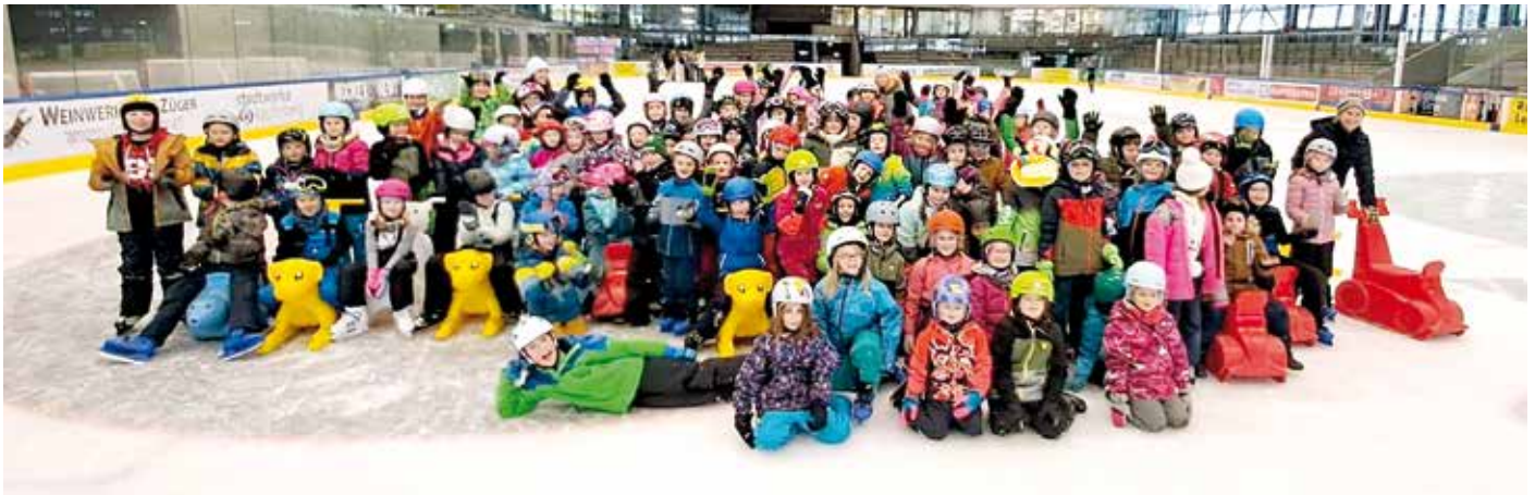
alle Klassen - Eislaufen: Im Jänner verbrachten wir einen Sport-Vormittag in der Eishalle Kapfenberg.